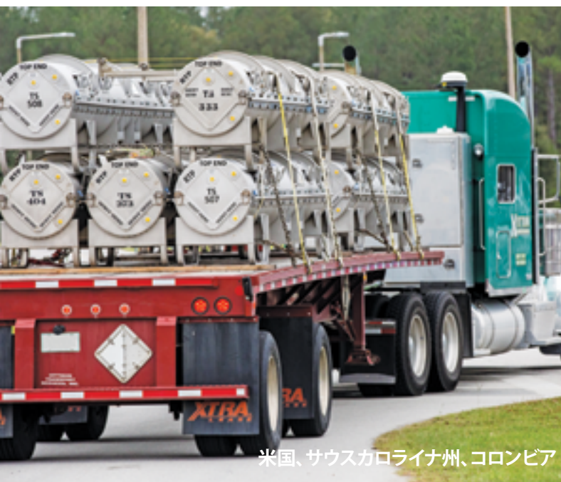
米国、サウスカロライナ州、コロンビア

質問 私は、新規契約のための入札プロセスを監督しています。韓国で取引を検討していたあるベンダーは、その提案が商業的な要件と技術的な要件をすべて満たすものであり、最安値を提示していたので、契約を獲得するだろうと私は思っていました。上司は別の候補であるベンダーを選ぶように指示してきたのですが、そのベンダーの提案はコストがより高く、商業的な要件と技術的な要件をすべて満たしていませんでした。