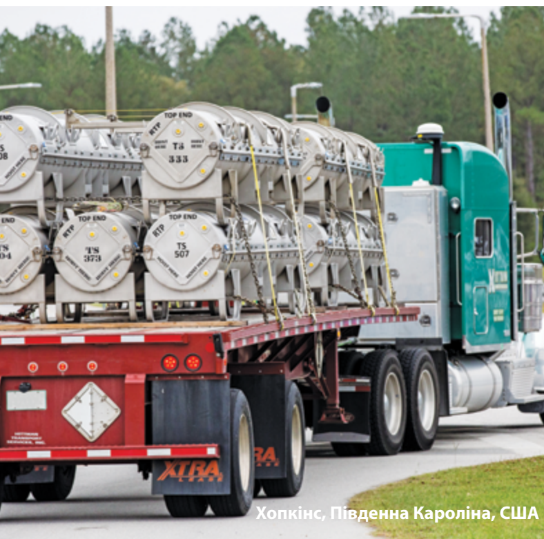
Хопкінс, Південна Кароліна, США

З Я відповідаю за вибір нового постачальника послуг для мого відділу. Мій зять працює в компанії, яка надає рішення, що може підійти для Westinghouse. Я знаю, що їхня компанія має чудову репутацію і надає послуги за дуже конкурентними цінами. Як мені їх залучити?