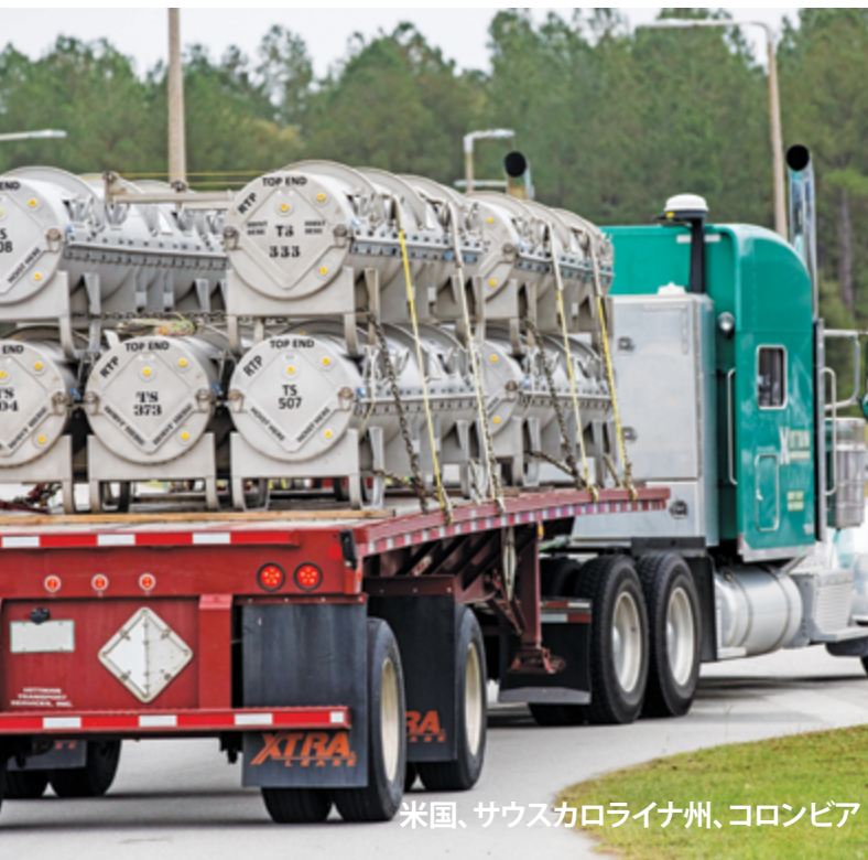
米国、サウスカロライナ州、コロンビア

回答 従業員の責任は、新しいサプライヤーを選択する際に、Westinghouseのグローバル倫理規範およびその他の適用されるすべての方針が確実に遵守されることを確認することです。あなたの親戚は、潜在的なサプライヤーのために働いているため、マネージャーとサプライチェーンに対し、その関係性を開示することが必要で、同社が契約を獲得した場合は、おそらく選択とサプライヤー管理プロセスから自分自身を削除する必要があります。すべての新しいサプライヤーの選択において、適切な方針に従う必要があります。サプライチェーンは当初から関与している必要があります。正式な見積もり依頼が必要となる可能性があります。Westinghouseにとって最高の価値提案を確保するために、契約を入札する必要があるかもしれません。単一または単独の供給元サプライヤーの選択が提案された場合、サプライチェーン方針に従って、適切な承認を得る必要があります。